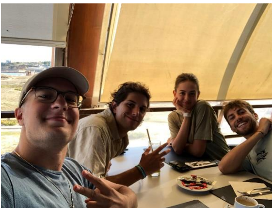
Olaszokkal Portugáliában 2.

Itt még írnek pár érdekességet: Pár barátal alakítottunk egy strandröplabda csoportot, ami végül kinötte magát és lettünk 60-an. Hetente lejártunk az egyik strandra (Malagán volt 3) és játszottunk, amíg le nem ment a nap.