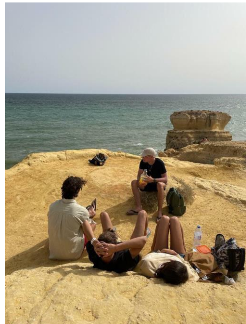
Olaszokkal Portugáliában 1.

Az elkövetkezendő hónapokban is utazgattam, eljutottam Dél-Spanyolország pár híresebb városába