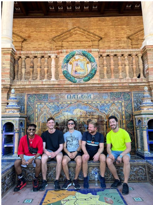
Sevilla -Plaza de Espana

Párszor voltam már Spanyolországban nyaralni, szóval előre képen voltam már, a kultúrával, az ételekkel, a hangulattal, és mindig is imádtam. Ezáltal elszánni magam,