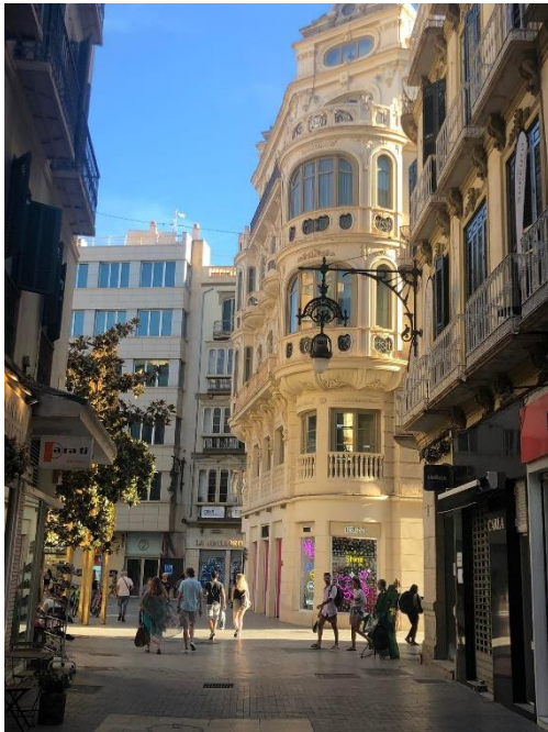
Malaga belvárosi épületek

A kinti Fogadóegyetemet „Universidad de Málaga” -nak hívják, ami röviden csak „UMA”. 2022/23-as év első félévében utaztam ki, és nagyjából 5 hónapig tartott a mobilitásom augusztus végétől január végéig. Kint inkább próbáltam olyan tantárgyakat felvenni, amelyek újak és érdekesek számomra. Szerencsére voltak angol nyelvű kurzusok is (spanyolul nem igazán beszéltem még), így a választásom 3 tantárgyra esett. Felvettem Machine Learning-et (Gépi tanulás), Mesterséges Intelligenciát és adatbázisokat. A tanáraink nagyon jó fejek voltak, de a tantárgyakkal meg kellett küszködni. Tapasztalataim alapján, inkább gyakorlatiasabbak az órák és jobban rámennek a beadandókra és kevés a dolgozatírás, és ha elegendő pontot összegyűjtesz a