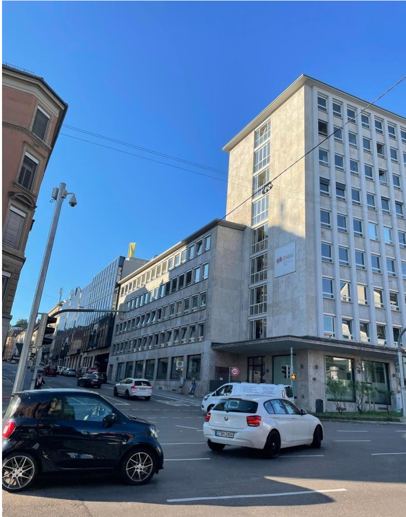
DHBW Gazdasági Kar Campusa a Rotebühlstrassen.

Az iskolába kb háromnegyed óra utazás után jutottunk el átszállással, S-bahn és U-bahn használatával.