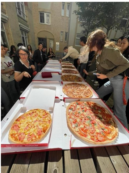
Ebéd a többi Erasmusos hallgatóval.

Az iskolába kb háromnegyed óra utazás után jutottunk el átszállással, S-bahn és U-bahn használatával.